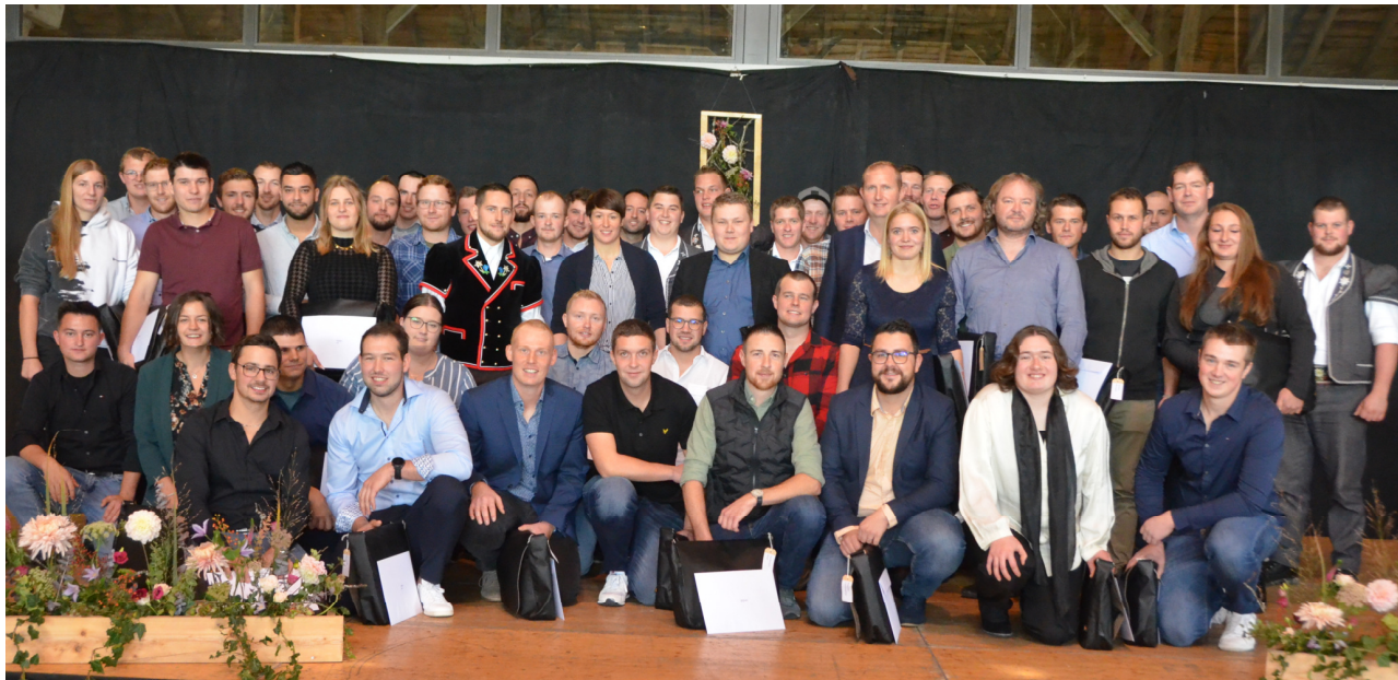
Les lauréates et lauréats du brevet de chef-fe d'exploitation agricole