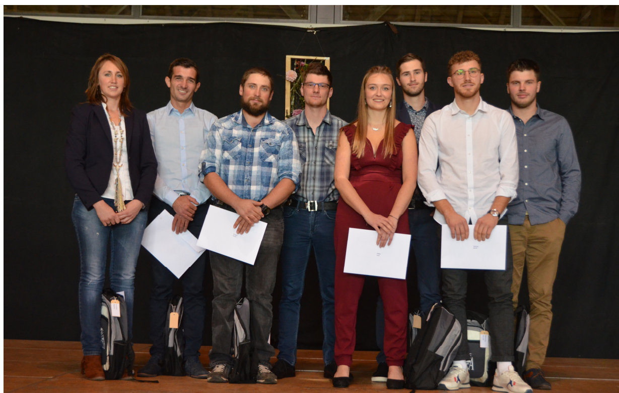
Les lauréates et lauréats de la maîtrise agricole