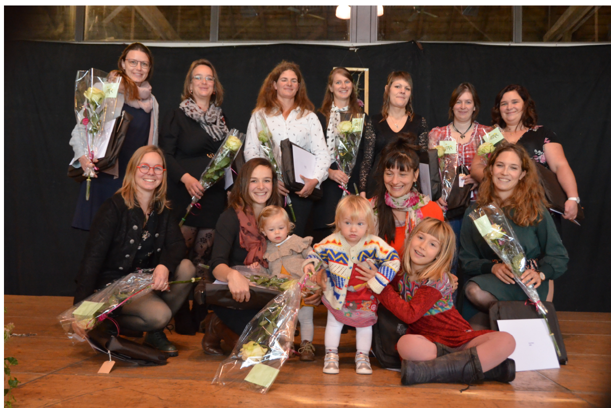
Les lauréates du brevet de paysanne