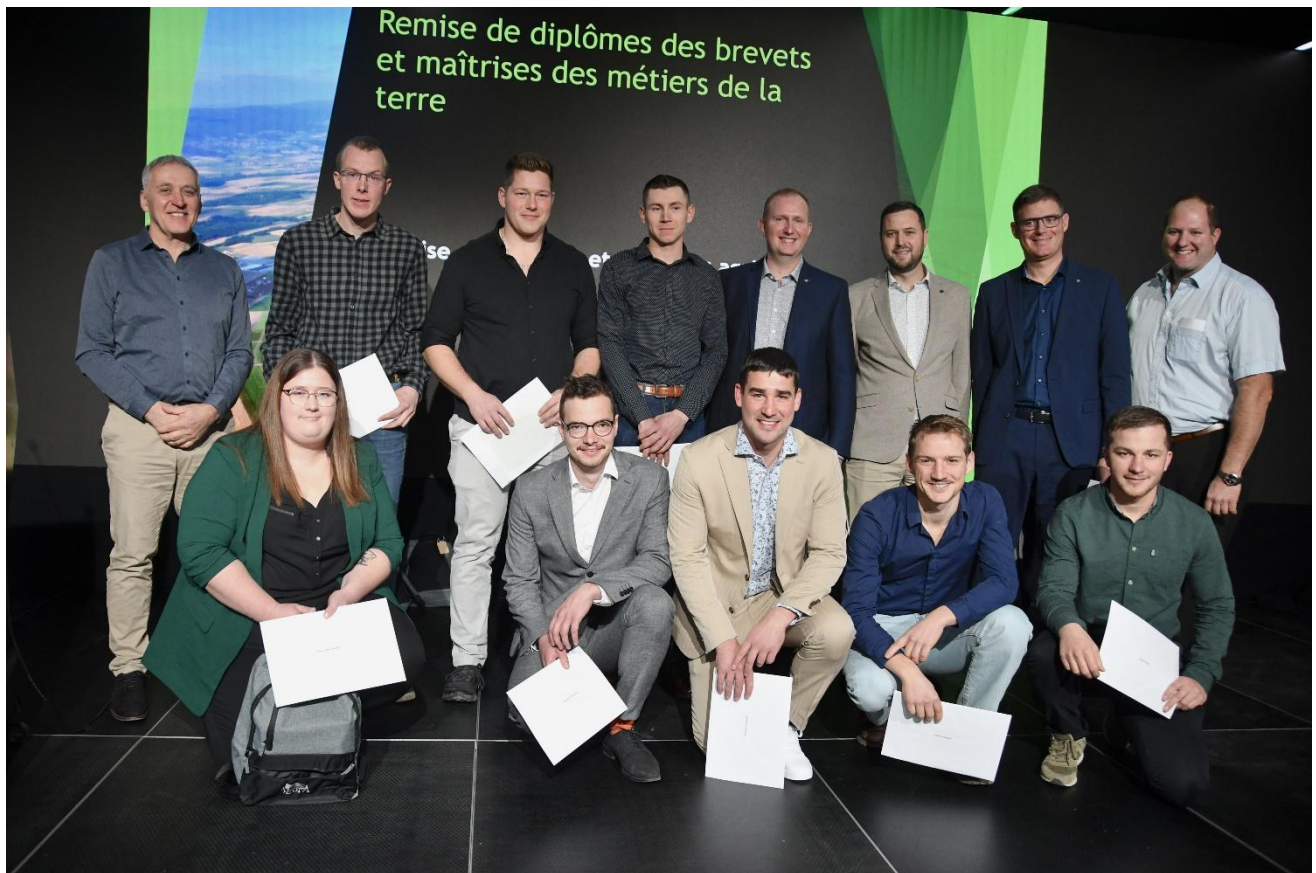
Les lauréates et lauréats de la maîtrise agricole NE, VD