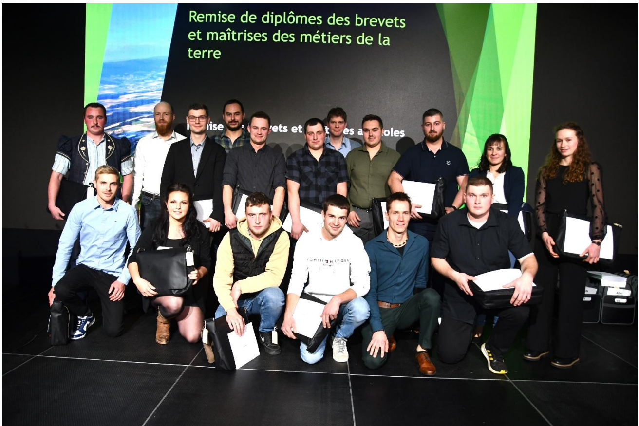
Les lauréates et lauréats du brevet de chef-fe d'exploitation agricole BE, FR, JU, NE