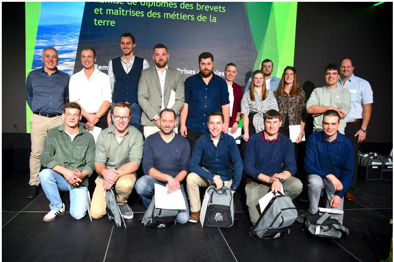
Les lauréates et lauréats de la maîtrise agricole FR, JU