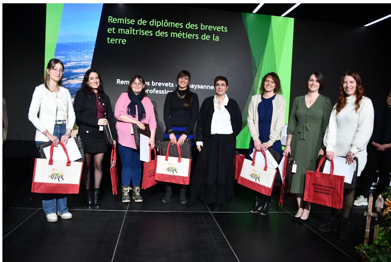
Les lauréates du brevet de paysanne