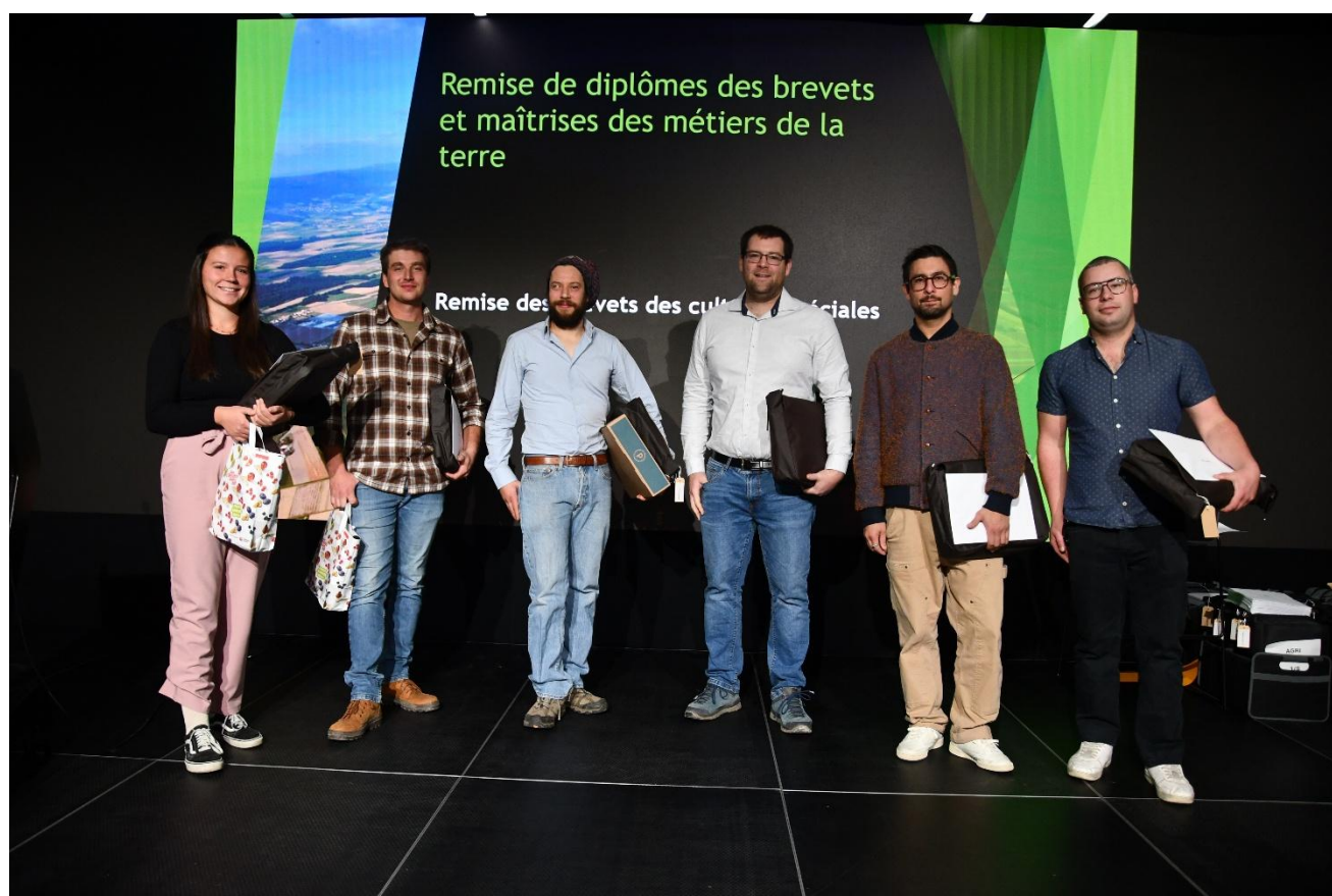
Lauréat.e.s en cultures spéciales