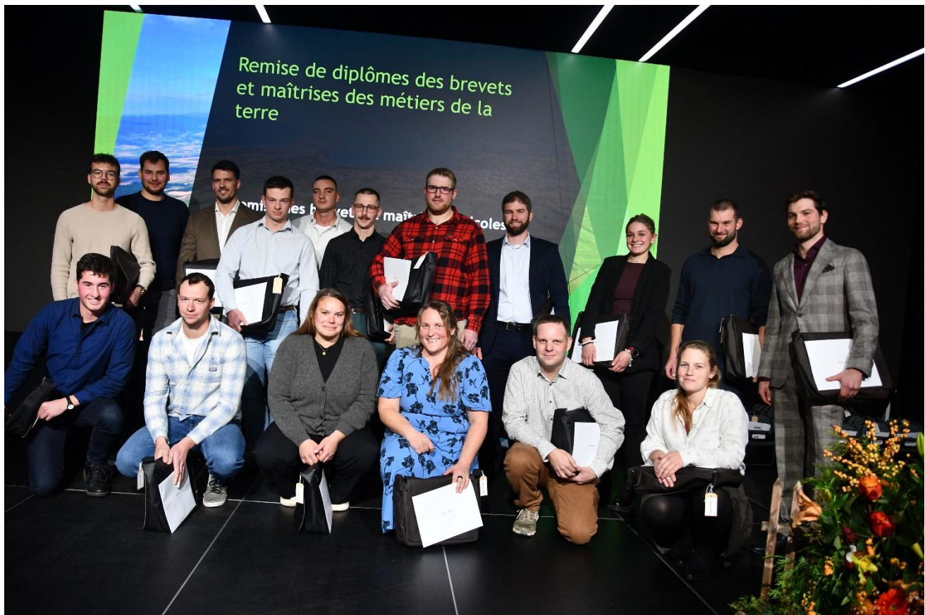
Les lauréates et lauréats du brevet de chef-fe d'exploitation agricole VS, VD