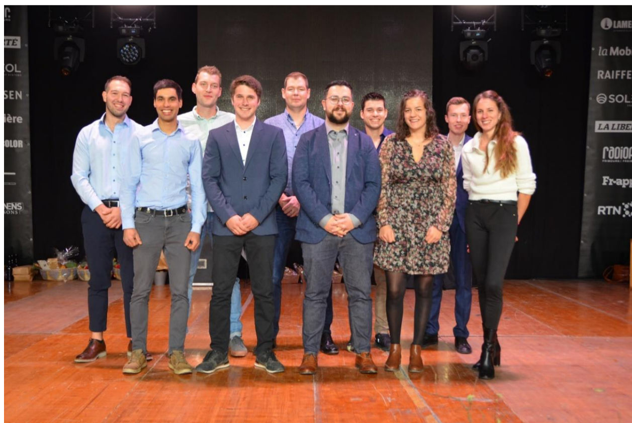
Les lauréates et lauréats de la maîtrise agricole