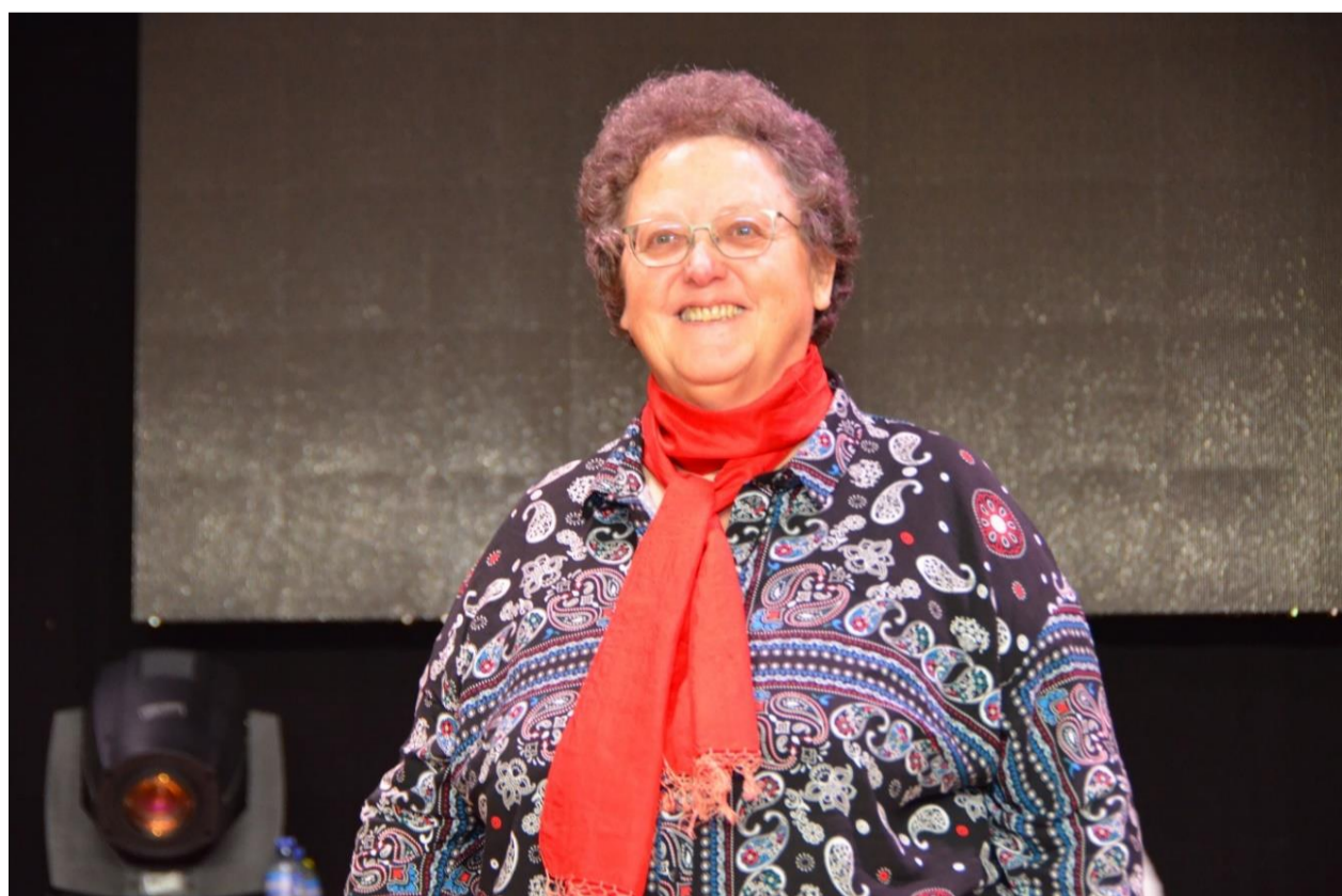
Lauréate du diplôme de paysanne