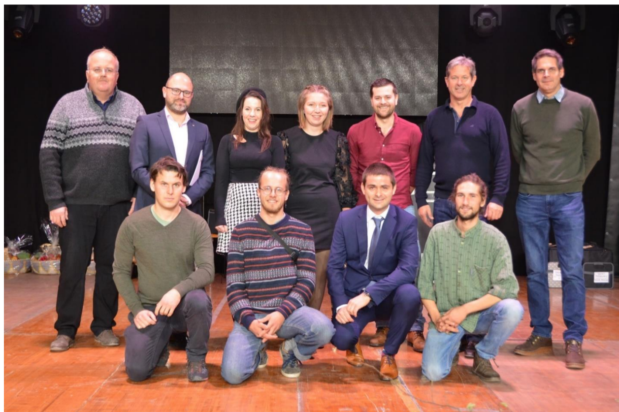
Lauréat.e.s en cultures spéciales