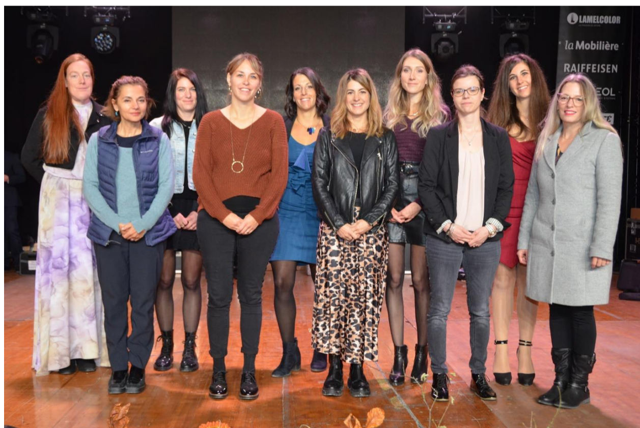
Les lauréates du brevet de paysanne