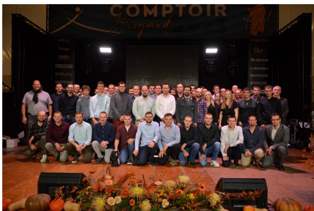
Les lauréates et lauréats du brevet de chef-fe d'exploitation agricole